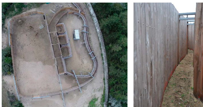
Bovenaanzicht van De Kraal (links) met schotten, deuren, loopbruggen en een steeds smaller wordende gang (rechts)

Het gebied is inmiddels uitgebreid van 220 naar 330 hectare en de kudde is nu 22 dieren groot. Het hek is lager (1,20 m) maar wel met hoogspanning. De oudste stier is vorig jaar overleden en opgezet in het bezoekerscentrum te zien. Binnenkort zullen er dieren overgeplaatst gaan worden naar andere gebieden in Nederland en stieren worden uitgewisseld met andere landen, om zo veel mogelijk inteelt te voorkomen. Om vervoer van wisenten mogelijk te maken moeten ze eerst gevangen worden. Daarvoor is een oude manege omgebouwd tot 'Kraal': een ingenieus bouwwerk van 2,5 meter hoog (omdat wisenten vanuit stilstand wel 2 meter hoog kunnen springen) en deuren en sluizen, zodat de dieren gescheiden kunnen worden en opgevangen in grotere of kleinere ruimtes en aan het eind zo de vrachtwagen in kunnen lopen, met zo min mogelijk stress.