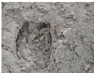
Allerlei sporen die de wisenten in het veld achterlaten

In de verte zien we opeens de kudde wisenten, tegen de horizon van Zandvoort en het geluid van het circuit. Langzaam proberen we dichterbij te komen zonder ze te verstoren. Ruud wijst ons onderweg op de kortere vegetatie en paadjes door de struiken die ontstaan zijn door de wisenten. Als we doorlopen zien we de kudde goed, met flink veel kalveren. Koeien kalven om het jaar af, zoals bekend van wisenten in natuurlijke situaties waarin niet of weinig bijgevoerd wordt. In gepamperde situaties, zoals dierentuinen, krijgen ze vaak jaarlijks een kalf. Sinds de oudste koe overleden is wordt er maandelijks een conditiecheck gedaan en de Body Condition Index bepaald.