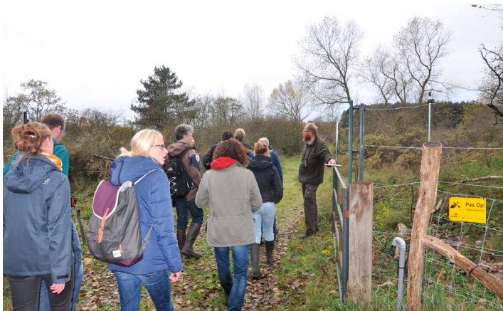
Toegangshek van het wisentengebied met hoogspanning

Lopend door het terrein vinden we allerlei wisentensporen, zoals opengewerkte bast van een Esdoorn, waar wisenten het sap uit gelijk hebben, mesthopen met restjes eikel waarin paddenstoelen groeien, zandhellingen waarop ze hebben liggen woelen, en pootafdrukken.