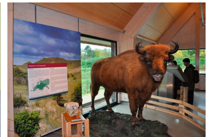
Opgezette stier in het bezoekerscentrum

Konijnen waren eeuwenlang de grazers van het duingebied, maar hun populatie stortte in. Mede daardoor is dit open gebied vergrast en begroeid geraakt met struiken en bomen. Sinds 2005 laat PWN (drinkwaterbedrijf en beheerder van de duinen in Noord-Holland) het duingebied begrazen met onder andere Schotse hooglanders en Konik paarden. In 2007 was de tijd rijp om als proef te starten met begrazing door wisenten, nadat al jaren verkennende studies waren uitgevoerd, mede op initiatief van Stichting Kritisch Bosbeheer, en in samenwerking met ARK Natuurontwikkeling en Stichting Duinbehoud. In 2005 maakten ze de notitie 'Wisenten in Kraansvlak' en regelden de financiering. Het Kraansvlak was een afgesloten gebied van 220 hectare binnen het Nationaal Park Zuid-Kennemerland en leek voor de begrazingsproef een ideaal gebied. PWN werd de facilitator, die verantwoordelijk was voor het terrein en het onderzoek; ARK en FREE Nature fungeerden als beheerder en eigenaar van de wisenten. Het doel van hun project was: