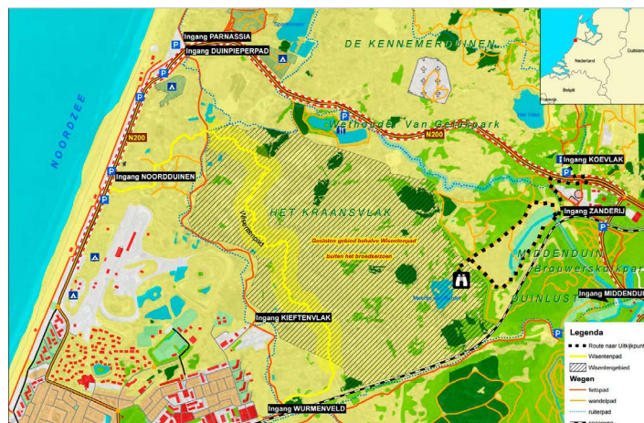
Het Wisentengebied Kraansvlak, nu 330 ha groot

Wandelend brachten we vanuit het bezoekerscentrum een bezoek aan het Kraansvlak onder leiding van PWN boswachter Ruud Maaskant. Eerst liepen we door een stuk duingebied van de gemeente Bloemendaal, waar Staatsbosbeheer de beheerder is en waar de wens ligt om dit bij het begrazingsgebied van de wisenten te betrekken. Voorbereidingen zoals aanpassing van het rasterwerk is al uitgevoerd. Mede vanwege vragen van ruiters geeft de gemeente echter geen toestemming en gaat uitbreiding (voorlopig) niet door.