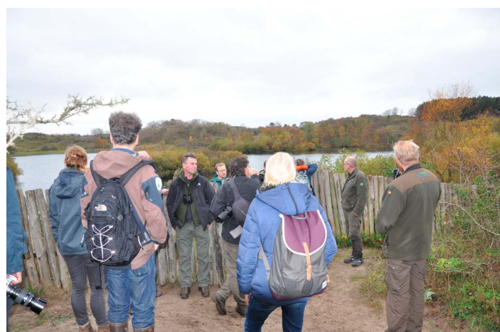
Het informatiebord en het wisenten-uitkijkpunt bij het duinmeer

Aangekomen bij het wisentengebied wacht ons een informatiebord en bezoeken we eerst het wisenten-uitkijkpunt. Vanaf dat punt heb je een mooi uitzicht op het meertje van Burdet dat als drinkplas door de wisenten wordt gebruikt. Indien nodig wordt het in de winter open gehouden met wakken.