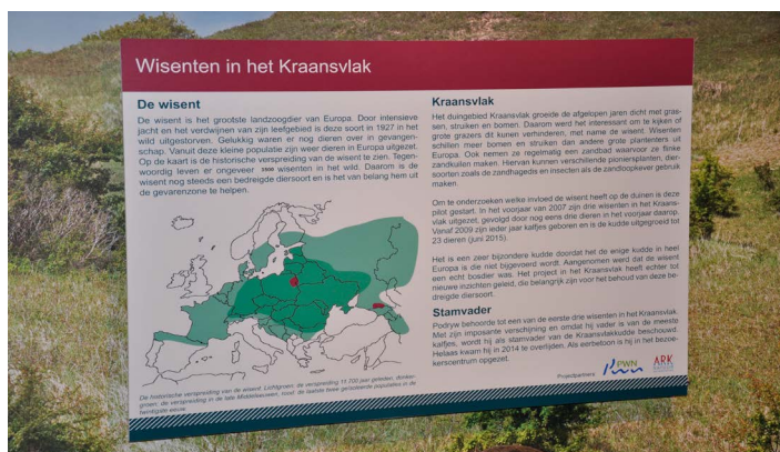
Informatiebord in het bezoekerscentrum over de wisenten

De Wisent (ofwel: Europese bizon) was 100 jaar geleden bijna uitgestorven in Europa. Door fokprogramma's en uitzettingen vanuit Polen komt hij nu op steeds meer plaatsen in het wild voor. Het Kraansvlak was de eerste plaats in Nederland; inmiddels zijn er voorbereidingen gaande om wisenten ook uit te zetten op de Veluwe, de Maashorst en Schiermonnikoog.