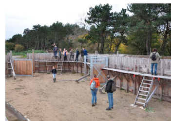
Boswachter Ruud komt via een loopbrug boven een zijgang uit, die de hoogte van de Kraal goed laat zien