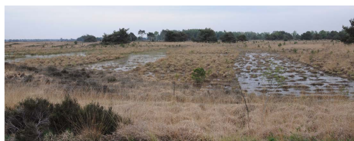
Geplagde heide volgens de visgraat methode

Onderzoekers van B-WARE kwamen net terug van metingen in het kader van hun onderzoek naar de werking van steenmeel, als mogelijke vervanger voor dolok (calcium + magnesium), dat een pH-piek veroorzaakt, en dus verzuuring en vergrassing. Ze vertelden ons dat men hoopt dat steenmeel deze negatieve effecten niet heeft. Gekeken wordt naar de samenstelling, werking en grofheid (grof is slow release, te grof gaat te langzaam?) van het steenmeel. Stichting Bargerveen onderzoekt in ditzelfde experiment de effecten op de fauna.