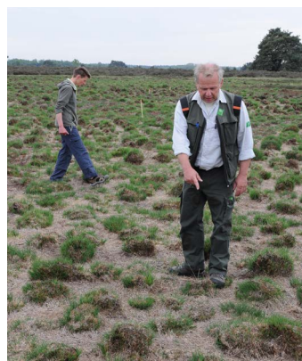
Recent afgebrande heide als maatregel tegen vergrassing

Even verderop lag een tijdelijke akker met nog een oud karrespoor, dat als cultuurhistorisch relict wordt bewaard. Vorig jaar is hier nog Boekweit op verbouwd, daarna is het ondiep gefreesd (hopelijk zaten de graafbijen diep genoeg) en nu wordt het extensief begrast door de schaapskudde. Er komt al jonge hei en Schapenzuring op.