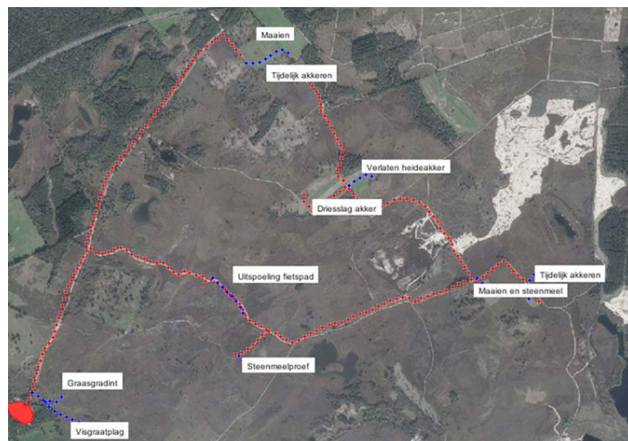
Fietsroute vanaf Werkschuur de Plaetse (tegen de klok in)

Na de lunch maakten we onder leiding van Jap Smits (Staatsbosbeheer) een fietstocht over de Strabrechtse Heide.