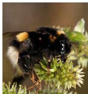
Wilgenhommel