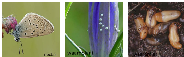
Soorten uit de levenscyclus van een Gentiaanblauwtje

Vlinders hebben in ieder geval een waardplant (waarop ze eitjes leggen) en een nectarplant (waaruit ze voedsel halen) nodig.