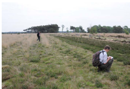
Tijdelijke akker na 2 jaar braakligging

Iets verderop zagen we het resultaat van de visgraat plagmethode. Op de graten groeit armetierige heide, maar langs de randen van de graten doet de hei het beter. Hier foerageren onder andere watersnippen, omdat daar iets te halen valt. In de vochtige delen komen heikikkers en rugstreeppadden voor. Ook wulpen komen er (nog) voor, maar er komen geen jongen meer groot, omdat er te weinig en te arm voedsel is. Het plagsel is naar golfbanen gegaan, waarmee ze proberen hun diversiteit te vergroten. Er is heel ondiep geplagd met een frees, net boven het zand, zodat het schoensmeerlaagje met de zaden is blijven zitten. Hierin leven ook de knooppieren, die van belang zijn voor het Gentiaanblauwtje. De jonge hei wordt jaarrond begrast door schapen (echter tussen 1 juni en half augustus niet bij de Klokjesgentiaan) en wordt elk jaar (eind februari, als het niet meer te nat is en voordat de Levendbarende hagedissen komen) afgebrand.