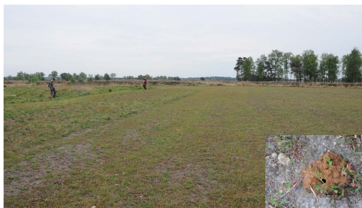
Tijdelijke akker met oud karrespoor, restanten van Boekweit (vorig jaar), Schapenzuring en holletje van een graafbij

Op een tijdelijk akkercomplex is eerst 2 jaar bemesting geweest (door schapen na het grazen hier 's avonds in te rasteren en te laten keutelen), daarna is er enkele jaren graan geteeld, daarna enkele jaren Boekweit en nu wordt de akker sinds 2 jaar alleen nog begrast met een schaapskudde. Aan de rand ligt nog een strook (donkergroen, met hogere heide, zie foto) die 10% is van het oppervlak waarop de Boekweit is verbouwd, en die is blijven staan voor de insecten. Tussen het gras vond iemand een Levendbarende hagedis.