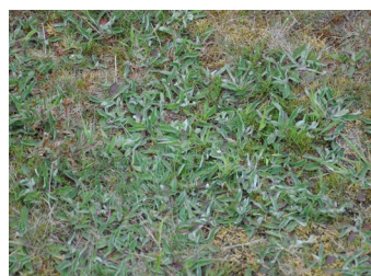
Muizenootje en net uit z'n huid gekropen Veldkrekkel

Ook bezochten we een stuk heide dat dit voorjaar afgebrand is als beheermaatregel. Het branden gaat heel gecontroleerd, maximaal een halve hectare, met rondom een brede, gemaaide en natgespoten rand. Onder deze oude hei leven mijnspringen (in schachten tot wel 40 cm diep). In het voorjaar (na het branden) komen de jonge mijnspringen naar boven, een lekkernij voor de Groene specht. Op dit veld is nu drukk begrazing van schapen, totdat de hei weer terugkomt.