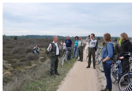
Fietspad met bloemrijke berm

In de berm van het fietspad bloeien veel nectarplanten (momenteel composieten en Stekelbrem) vanwege de mineralenrijkdom door uitspoeling vanuit de grindverharding van het pad. Dit veroorzaakt een duidelijke verhoging van de biodiversiteit. Een Grijze zandbij liet zich makkelijk vangen in een buisje. Ook werd gewezen op het wilgenstruweel langs de Witte Loop, waar vroege voorjaarsinsecten zich kunnen voeden.