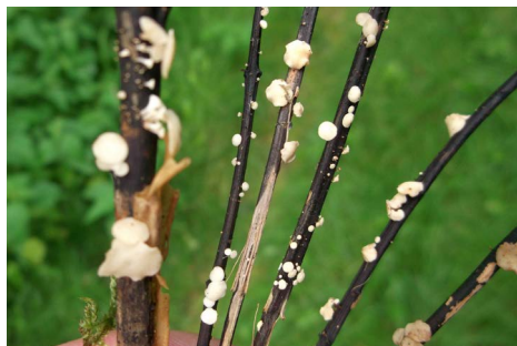
Hymenoscyphus fraxineus

De es ( Fraxinus excelsior ) heeft een zeer diverse waarde (windvanger, schaduwboom, houtproductie, cultuurhistorie en ecologie) en is sinds de jaren 50 in toenemende mate aangeplant, zowel als zaailing als vegetatief vermeerderde cultivar. De es komt vooral in het noorden en westen van Nederland voor, vanwege zijn goede tolerantie voor natte grond (klei en veen), wind en zeewind.