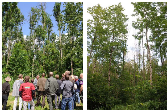
Aangetaste essen in het Roggebotzand

Het Roggebotzand is een bosgebied dat kort na de inpoldering van Oost Flevoland (gereed in 1957) is aangeplant op een oude zandbank van de voormalige Zuiderzee. Het is circa 800 ha groot en het oudste bos van de Flevopolder.