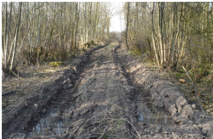
Ontsluitingspad nodig voor beheer

Inplanten moet op alle leegkomende plaatsen gebeuren: bij een bedekking van <25% in grote groepjes en bij een bedekking van 25-40% in kleine groepjes. Tussen de groepjes wordt 80% Els en 20% Wilg en Populier geplant. Het aandeel essen wordt maar voor de helft meegeteld. Voor het inplanten wordt er gemaaid of geklepeld; na het inplanten wordt er 3x per jaar gemaaid en na 2 jaar langzaam geminderd. Niets doen vraagt veel geduld (zonder Els kan het heel lang duren).