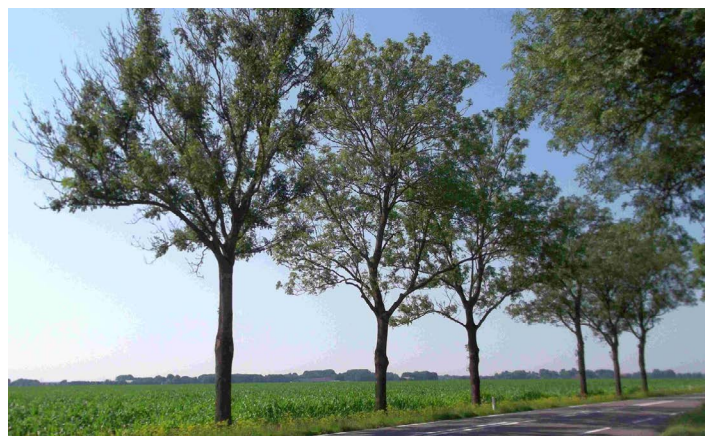
De ene es is gevoeliger voor essentaksterfte dan de andere

Sinds de jaren 90 komt de essentaksterfte in Europa voor. Deze is vanuit Polen snel opgerukt naar West- en Noord-Europa. Sinds 2009 komt de ziekte ook in Nederland voor en weten we dat dit veroorzaakt wordt door de schimmel Hymenoscyphus fraxineus . Die komt reeds lange tijd voor op de Fraxinus mandschurica in het Noordoosten van Azië, maar geeft daar weinig schade. De schimmel verspreidt zich over grote afstanden via sporen door de lucht. Via het blad dringt het schimmelweefsel de takken binnen en van daar uit verder de boom in. De ziekte is te herkennen aan een donkere verkleuring van de bast en daarna het afsterven van de takken vanuit de toppen van de boom. Het is desastreus voor vele bossen en beplantingen.