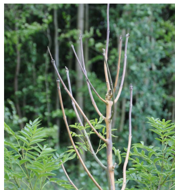
Aangetaste essen in de genenbank

aantasting kan langer afgewacht worden, want de mate van aantasting kan wisselen: soms worden essen nauwelijks aangetast, soms na een jaar toch veel meer. De beste tijd van inventarisatie is aan het begin van de zomer, zo rond eind juni.