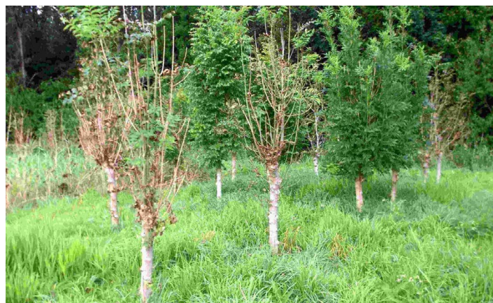
Klonen in duplo aangeplant geven hetzelfde beeld

Een probleem is echter nog de (financiële) onzekerheid over de voortzetting van het onderzoek. Om beter te kunnen adviseren is het noodzakelijk om klonen en zaad van veelbelovende bomen onder gecontroleerde omstandigheden te testen op gevoeligheid voor de ziekte.