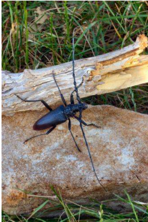
Cerambyx cerdo (Coleoptera, Cerambycidae)