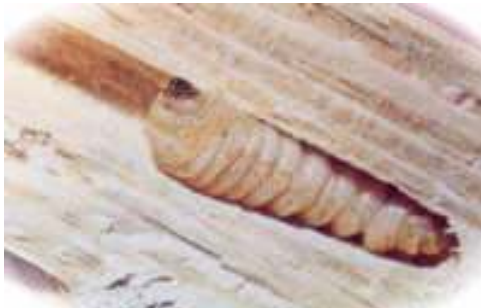
Hylotrupes spec. larve (Coleoptera, Cerambycidae)