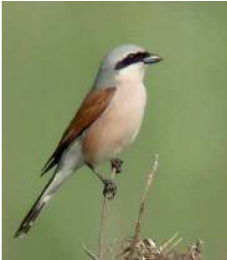
Grauwe klauwier met voedselspectrum