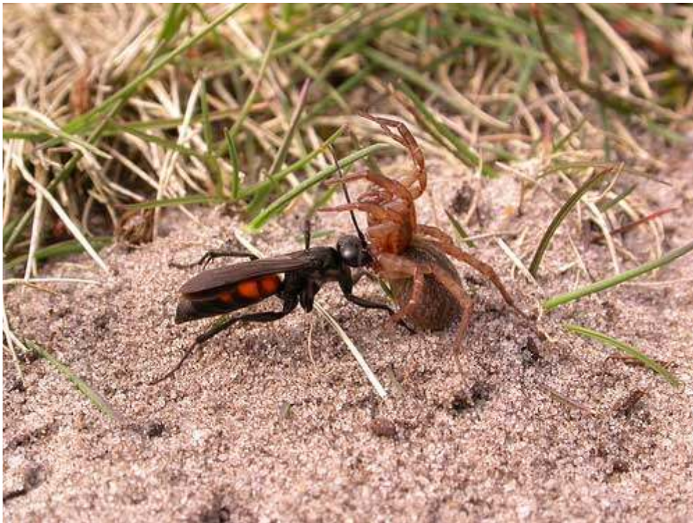
Spinnendoder ( Anoplius viaticus )