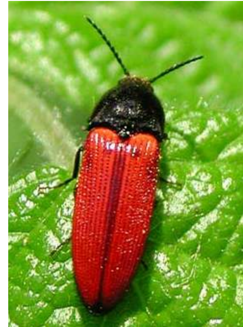
Elateridae (Coleoptera), rechts adulte Ampedus spec.