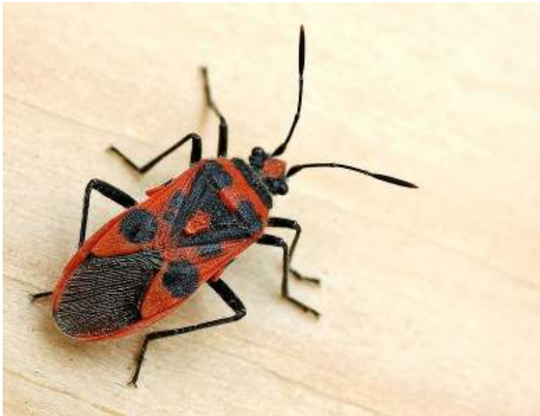
Coryzus hyoscyami (kaneelwants)

Decticus verrucivorus (wrattenbijter) nu in de duinen uitgestorven.