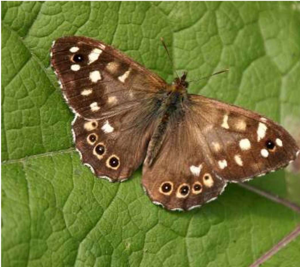
Bont zandoogje ( Pararge aegeria )